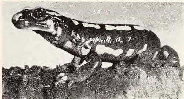
Abb. 4. Dasselbe Tier wie Abb. 3, von der Seite (Aufnahmen Zimmermann & Feldmann).

Alle Feuersalamanderpopulationen, die ich in Westfalen beobachten konnte, rechnen zur westlichen Rasse terrestris ; im Weserbergland, wo man allenfalls mit Vertretern der östlichen Form oder doch mit Mischformen rechnen könnte (Hecht 1933, p. 180) sind bislang ausschließlich fleckenstreifige Stücke festgestellt worden 13) . Preywisch (briefl.) beschreibt den F. der